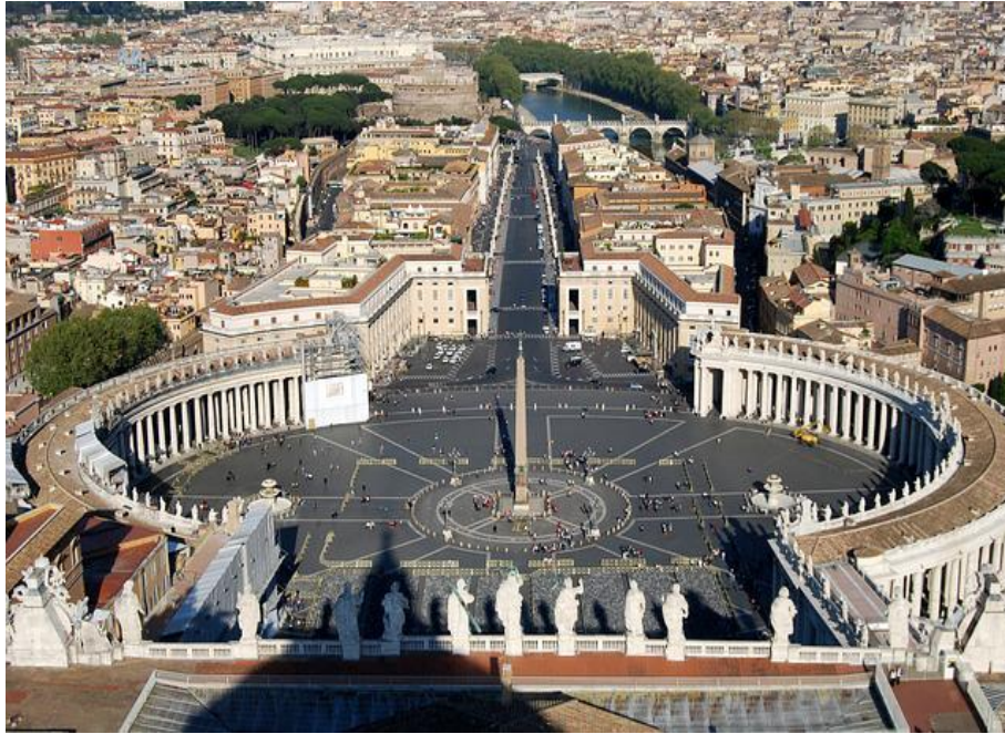
Blick über den Petersplatz von der Kuppel des Petersdom

Der Petersdom wurde zwischen 1506 und 1626 erbaut. Die Liste der Baumeister und Bauleiter die ihre Spuren hinterließen ist lang und beinhaltet u.a. Donato Bramante und Michelangelo. Bis zu 20.000 Menschen fasst der Petersdom mit seiner Grundfläche von 15.160 m 2 . Erbaut wurde der Petersdom an der Stelle an der man das Grabmal vom Apostel Petrus vermutet. Alt-St. Peter wurde bereits von Konstantin des Großen in 324 erbaut. Die riesige Kuppel endet auf einer Höhe von 132,5 m. Dies kann auch bestiegen werden, was unbedingt empfehlenswert ist. Oben angekommen bietet sich ein grandioser Ausblick über den Petersplatz sowie ganz Rom. Wer auf die Kuppel will, hat die Wahl gänzlich die Treppe zu nutzen (Preis 5 €) oder teilweise den Aufzug zu nehmen (Preis 7 €).