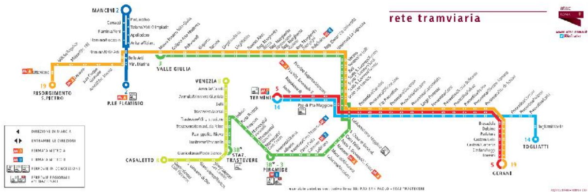
Straßenbahn Netz in Rom

6 verschiedene Straßenbahn Linien stehen im Zentrum von Rom dem Besucher zur Verfügung