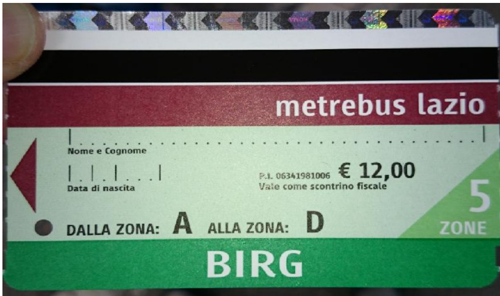
BIRG Ticket: Gültig für einen Tag bis 24.00 Uhr