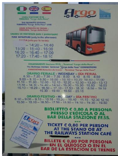
Buslinie Hafen-Bahnhof Civitavecchia

Im Hafengelände darf man nicht zu Fuß unterwegs sein. Aus diesem Grund bringt der Hafen-Shuttle-Bus alle Gäste zum Eingang/Ausgang des Hafengeländes. Dort befindet sich ein Parkplatz, von dem aus man später wieder zurück zum Schiff gebracht wird. Man wird auch von ein paar Reisebüros erwartet, die ihre Ausflüge nach Rom anbieten. Die lässt man aber links liegen und geht zur kleinen Hütte und kauft dort ein Busticket zum Bahnhof Civitavecchia. Kostenpunkt 0,80 € Einfahticket.