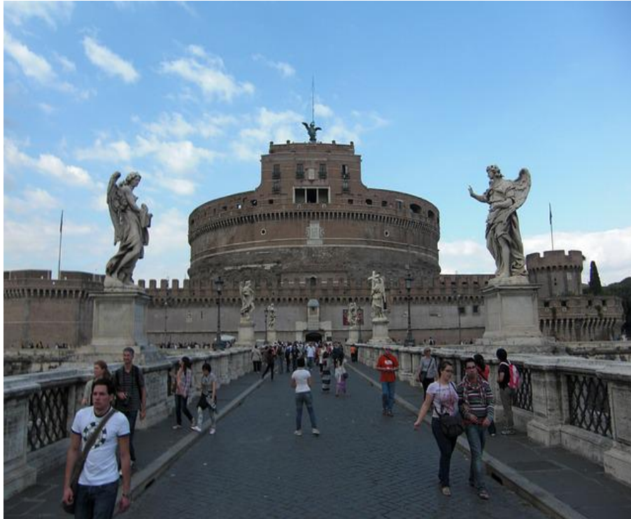
Engelsburg und die Engelsbrücke