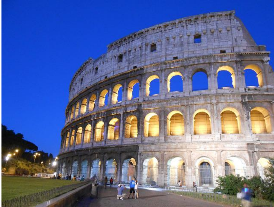
Kolosseum bei Nacht